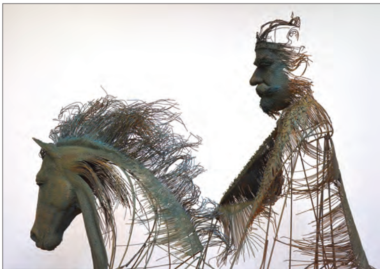
Regele Ferdinand călare (detaliu), sârmă, 300 x 300 x 120 cm, 2017

Darius Hulea creează remarcabile sculpturi din sârmă sudată, pe care le numește „desene tridimensionale”, aducând un omagiu marilor personalități românești creatoare de cultură (Brâncuși, Enescu, Cioran, Eliade, etc.). Astfel, într-o manieră originală, care surprinde nu doar asemănarea fizică, ci și ființa simbolică, îi înfățișează într-un mod spectaculos, aflat la granița dintre modernitate și contemporan, între redarea clasică și stilizarea formelor, pe cei doi suverani în timpul căror domnii s-a înfăptuit Marea Unire, regele Ferdinand și regina Maria, dar și pe regele Mihai și regina Ana.