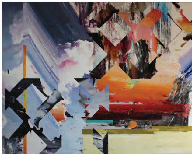
Straturi. Viață , ulei pe pânză, 150 x 190 cm, 2018

Pavel Grosu construiește structuri compoziționale prin intermediul colajului digital, pe care-l transpune apoi în picturile sale abstracte cu aspect decorativ, transmițând o ușoară melancolie mascată într-o cromatică vibrantă. Este preocupat de ideea fragilității amintirilor, a capacității de a surprinde vizual cât mai exact o anumită amintire sau de a reconstitui o anumită stare. Compozițiile sale monumentale transmit în special prin cromatică lor senzații și fragmente dintr-o Românie colorată, primitoare, o Românie a diversității.