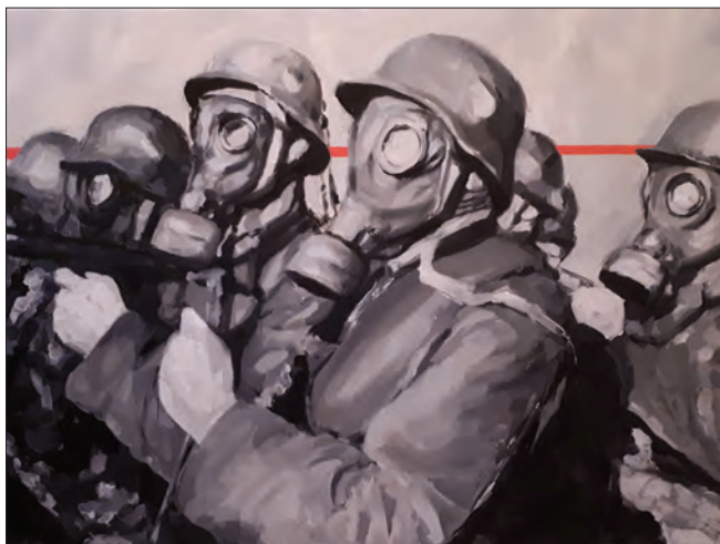
Temnița libertății , ulei pe pânză, 60 x 80 cm, 2018

Ada Muntean explorează potențialul expresiv și conceptual al corpului uman în relație cu aspecte existențiale relevante în contemporaneitate, realizând o radiografie vizual-plastică a dezumanizării individului în societatea contemporană. Instalația Temnița libertății reconstituie formal și conceptual o parte din evenimentele sângeroase petrecute în România ultimilor 100 de ani, materializându-se ca o intervenție artistică de reflecție asupra libertății, adevărului, istoriei, războiului, păcii. Instalația îmbină pictura cu obiecte ready-made (TV, neoane, cătușe, etc.), sugerând la nivel conceptual specificul realității cotidiene ce devine o închisoare mentală pentru omul obișnuit, legitimând închisoarea fizică pentru cei care își creează propria lege.