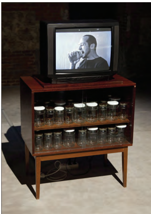
Borcane , instalație video, dimensiuni variabile, 2010