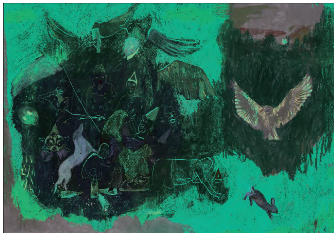
Carnaval zilnic , pastel uleios pe hârtie, 35 x 50 cm, 2018

Diana Oțet se raportează la valorile culturale și spirituale românești, fiind autoarea unor compoziții grafice care surprind elemente aparent banale, redată stilizat, sugerând stări profund meditative. Privind România drept un loc plin de potențial și de contradicții, transpune Carnavalul zilnic al societății românești cu reminiscențe ideologice ce amintesc de inflexibilitatea regimului comunist. Dragonul haosului problematizează metaforic provocările și neajunsurile de ordin social și ontologic ale acestui spațiu. Artista întrezărește însă strălucirea, frumusețea și speranța acestor locuri și oameni, transpunând o simbolică solară ce potențează dimensiunea spirituală a existenței.