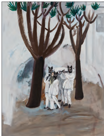
Anca Brânzaș, Ritual funerar dacic, ulei pe pânză, 116 x 90 cm, 2015