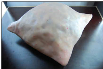
Felix Deac , Pernă moartă , 2011, sculptură tehnică mixtă, 35 x 32 x 16 cm