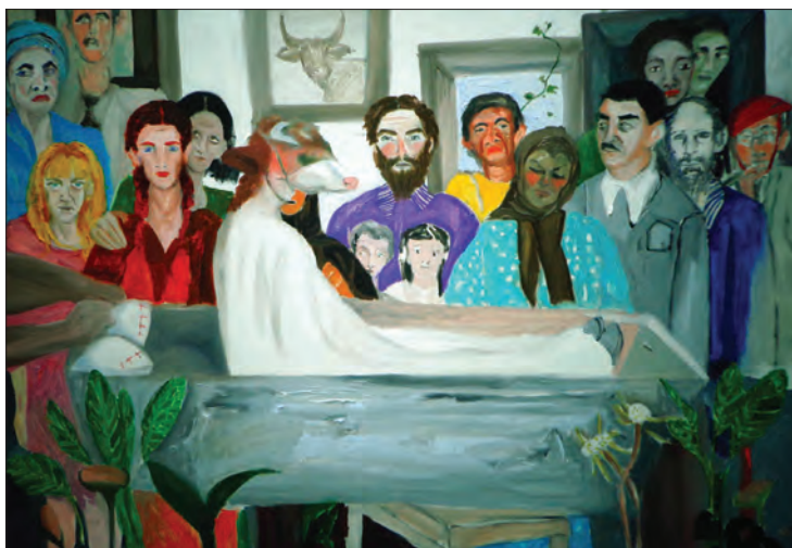
Înmormântarea , ulei pe pânză, 100 x 140 cm, 2014

Anca Brânzaș conturează într-o tușă spontană și tensionată, de influență expresionistă atât elemente din folclorul românesc, în special motive zoomorfe cât și diferite scene cu trimitere la ritualuri funerare. Înmormântarea sugerează atitudinile umane în fața morții în zona românească rurală încărcată de superstiții. Înfățișând într-o notă ironică niște personaje aliniate lângă un sicriu, din care tocmai s-a ridicat un personaj cu mască zoomorfă, artista face haz de necaz , o trăsătură specifică a creației sale, dar și o constantă a spiritului românesc, care folosește umorul ca armă pentru depășirea dificultăților.