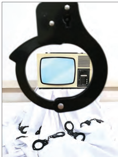
Ada Muntean , Temnița libertății (detaliu), instalație: 3 picturi în ulei pe pânză (60 x 80 cm), 2 picturi (25 x 30 cm), TV, 6 neoane, 20 de cătușe negre, material textil alb și blană