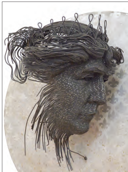
Darius Hulea, Portretul Reginei Maria, (detaliu) sârmă sudată, 112 x 112 x 50 cm, 2018