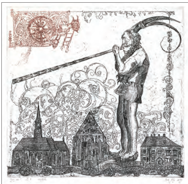
Clujul meu (detaliu), acvaforte, 27 x 21 cm, 2015

Rada Niță , autoarea unor gravuri rafinat meșteșugite, ne călăuzește în universul ei fermecat, populat cu făpturi fantastice. Acestea, deși cu rădăcini în folclorul românesc, aparțin totuși unui bestiar personal, ce jonglează cu referințe la credințele central și est-europene și la imaginarul medieval. De la Turcă (dansul caprei) la femeia care toarce Busuioc în păr , regăsim trimiteri la străvechi descântece românești și ritualuri prețuite până astăzi.